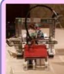
手作り3Dプリンター