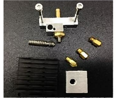
作れる部品は工業高校生が製作