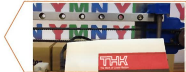
LMガイド(東根市で製造)