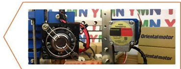
オリエンタルモーター様からのご提供 ステッピングモーター、ファンモーター(鶴岡市で製造)